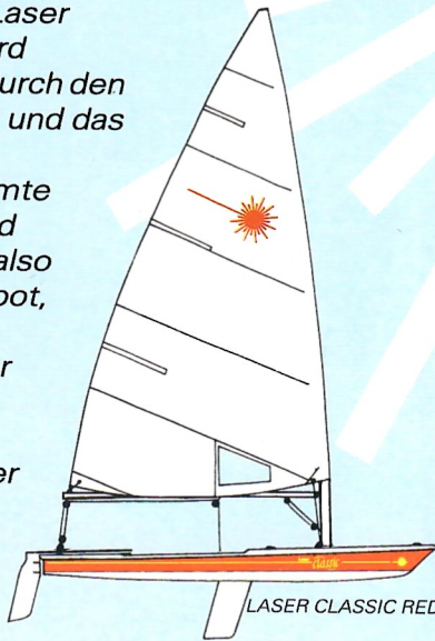
LASER CLASSIC RED

Formula Laser heißt drei verschiedene Bootstypen in einem Boot. Laser 4.7, Laser Radial und Laser Standard unterscheiden sich nur durch den unteren Teil des Mastes und das Segel – der Rumpf, die Beschläge und die gesamte restliche Ausrüstung sind identisch. Sie brauchen also nicht gleich ein neues Boot, wenn Ihre seglerischen Fähigkeiten oder auch Ihr Gewicht zugenommen haben. Sie vergrößern einfach Ihr Rigg. Auch der erfahrene Laser Segler kann das Konzept "Formula-Laser" nutzen. Durch ein zusätzliches Rigg wird Ihr Laser vielseitig verwendbar.